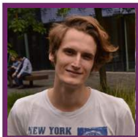
Eli de Smet Onderwijsorganisatie